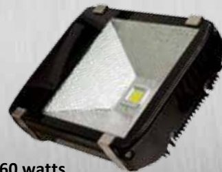
60 watts 6 000 lumens