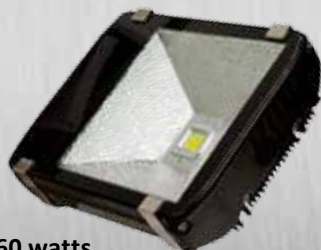
60 watts 6 000 lumens